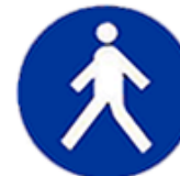
Passaggio obbligatorio per i pedoni