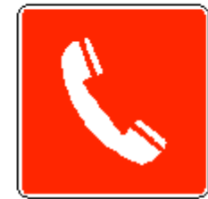
Telefono per interventi antincendio