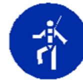
Protezione individuale obbligatoria contro le cadute dall'alto