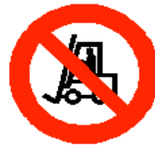
Vietato ai carrelli di movimentazione