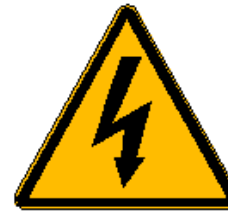
Tensione elettrica pericolosa