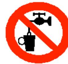
Acqua non potabile