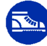
Calzature di sicurezza obbligatorie