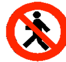
Vietato ai pedoni