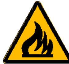
Materiale infiammabile o alta temperatura