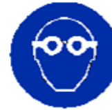
Protezione obbligatoria degli occhi