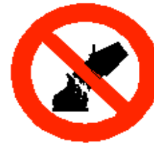
Divieto di spegnere con acqua