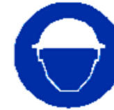
Casco di protezione obbligatorio