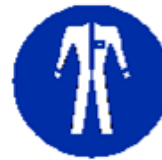
Protezione obbligatoria del corpo