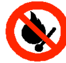
Vietato fumare o usare fiamme libere