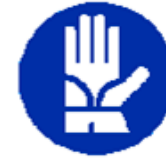
Guanti di protezione obbligatori