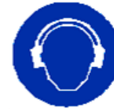
Protezione obbligatoria dell'udito