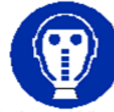
Protezione obbligatoria delle vie respiratorie