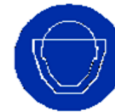
Protezione obbligatoria del viso