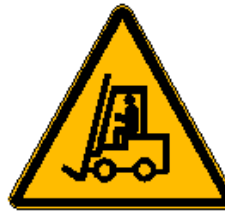
Carrelli di movimentazione