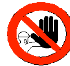
Divieto di accesso alle persone non autorizzate