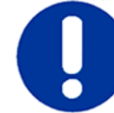
Obbligo generico (con eventuale cartello supplementare)